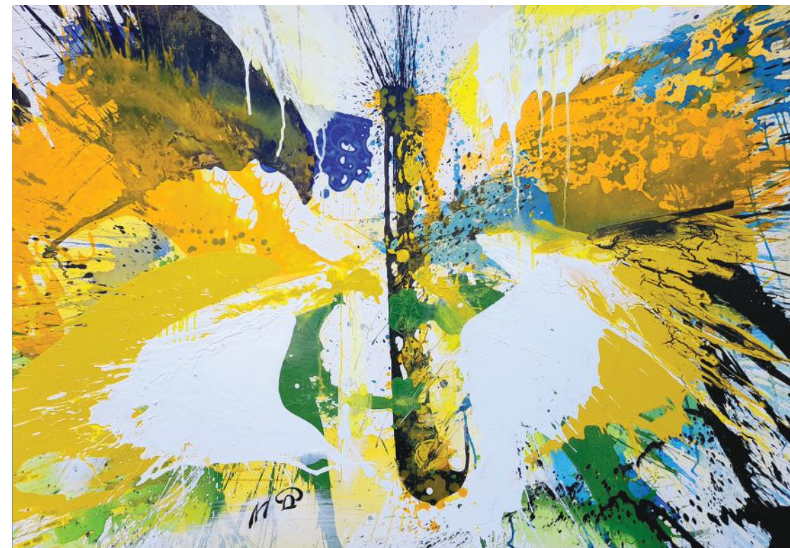
LEPTIR 90 x 130 cm akril na platnu 2022.