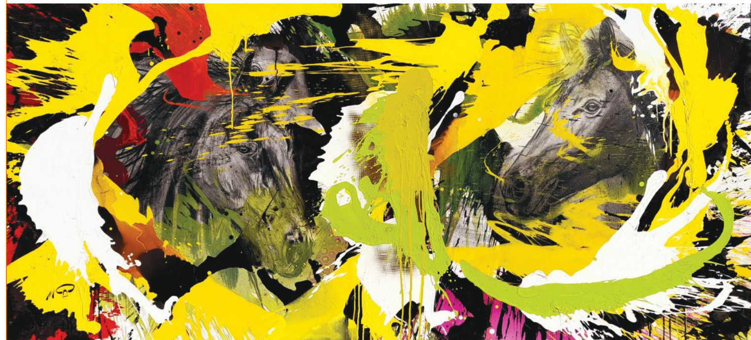
IGRA 110 x 240 cm ugljen i akril na platnu 2022.