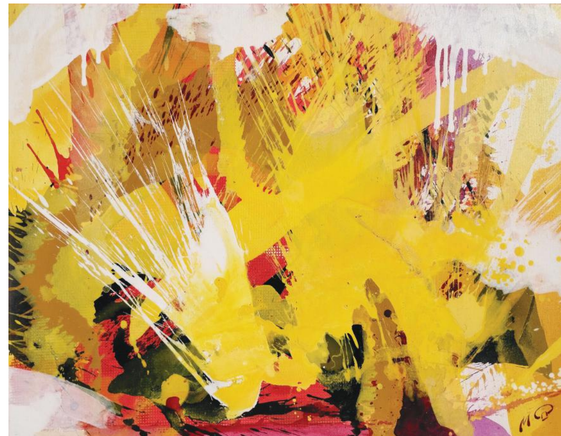
EUFORIJA I 85 x 110 cm akril na platnu 2022.