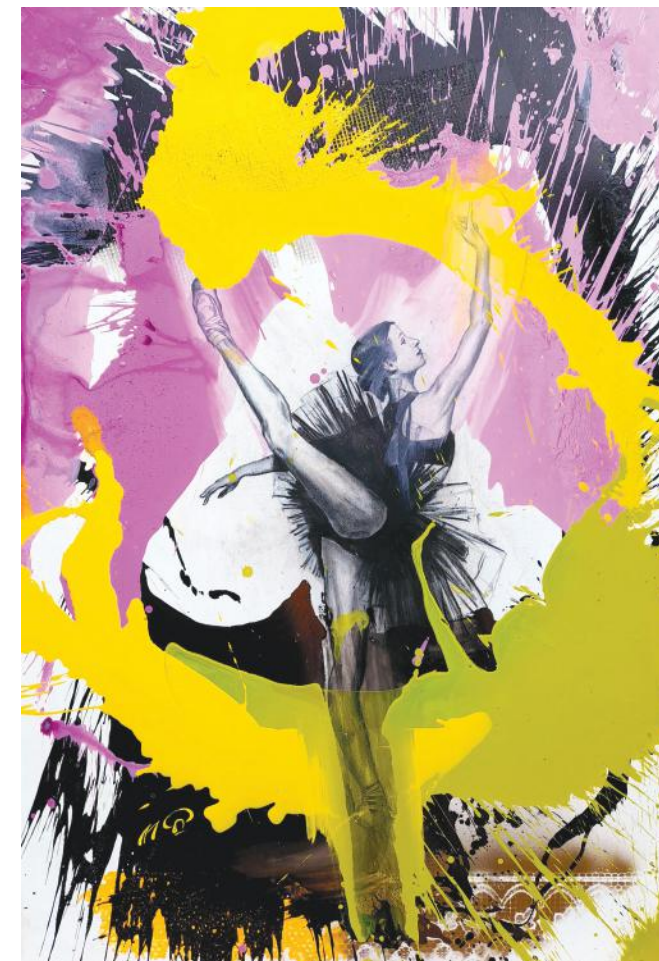
CRNI LABUD 130 x 90 cm ugljen i akril na platnu 2022.