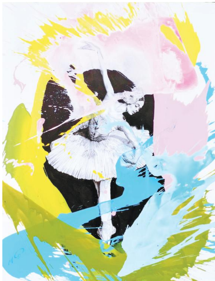
BIJELI LABUD ugljen i akril na platnu 110 x 85 cm 2022.