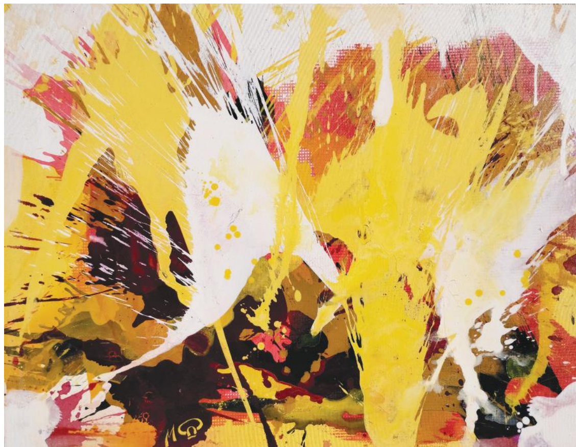
EUFORIJA II 85 x 110 cm akril na platnu 2022.