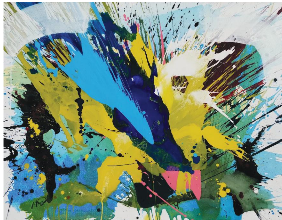
RAJSKA PTICA II 85 x 110 cm akril na platnu 2022.