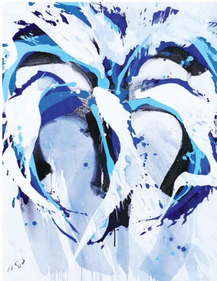
LILJAN I 110 x 85 cm akril na platnu 2022.