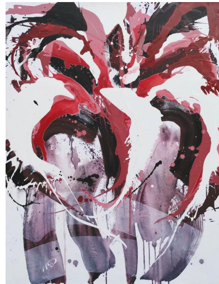
LILJAN II akril na platnu 110 x 85 cm 2022.