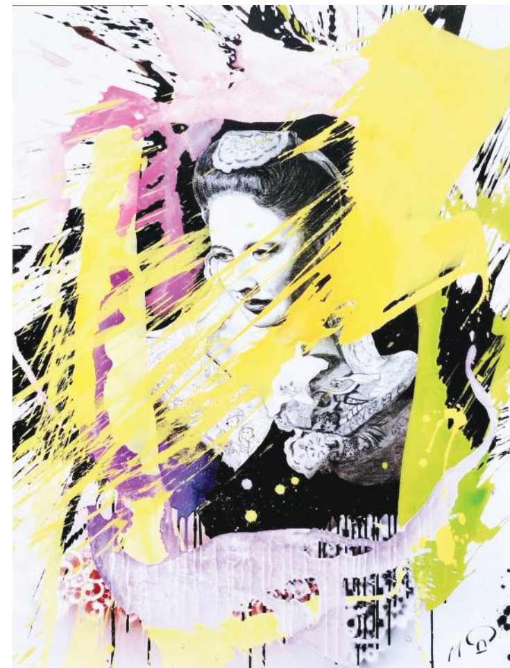
SREBRENKA SENA JURINAC ugljen i akril na platnu 110 x 85 cm 2022.